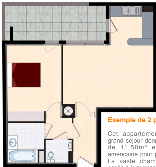
Exemple de 2 pièces : 49,10m 2

Cet appartement bénéficie d'un grand séjour donnant sur la terrasse de 11,50m 2 et d'une cuisine américaine pour plus de convivialité. La vaste chambre dispose d'un accès à la terrasse.